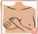
۶ بصورت دایره ای