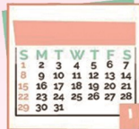
۱ ماهی یکبار خودآزمایی را انجام دهید