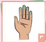
۳ به آرامی از نوک انگشتان استفاده کنید