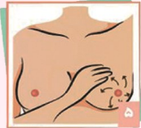
۵ بصورت نیمه دایره