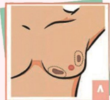
۸ تغییرات پوست سینه