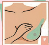
۲ ناحیه پستان و زیر بغل را بررسی کنید