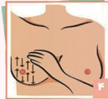
۴ بالا و پایین سینه