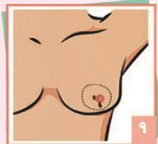
۹ تغییرات یا ترشحات نوک سینه